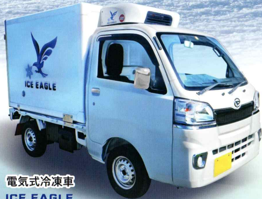
電気式冷凍車 ICE EAGLE