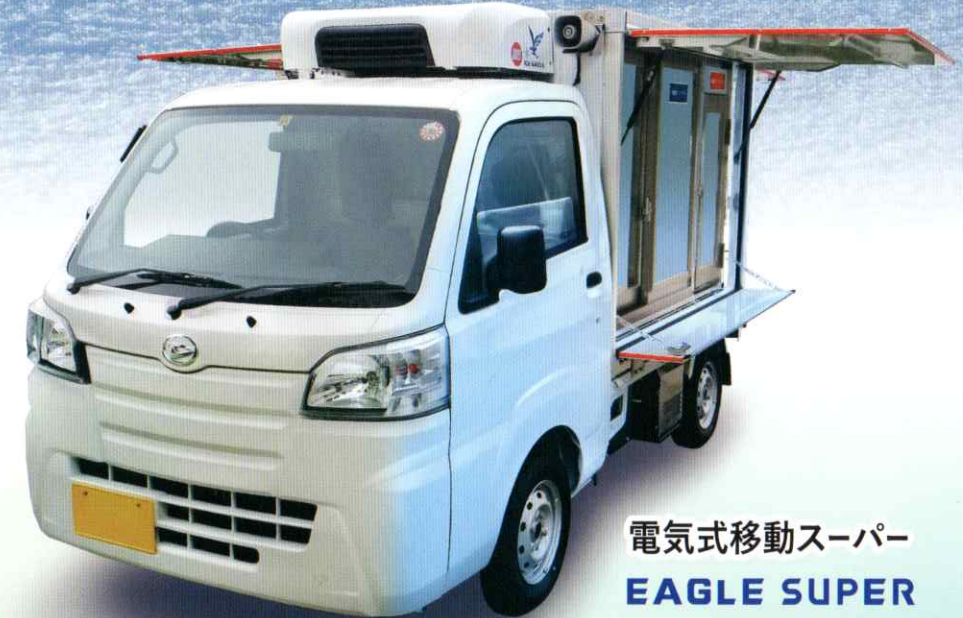
電気式移動スーパー EAGLE SUPER 扉は3方跳ね上げ式で買物客の利便性大